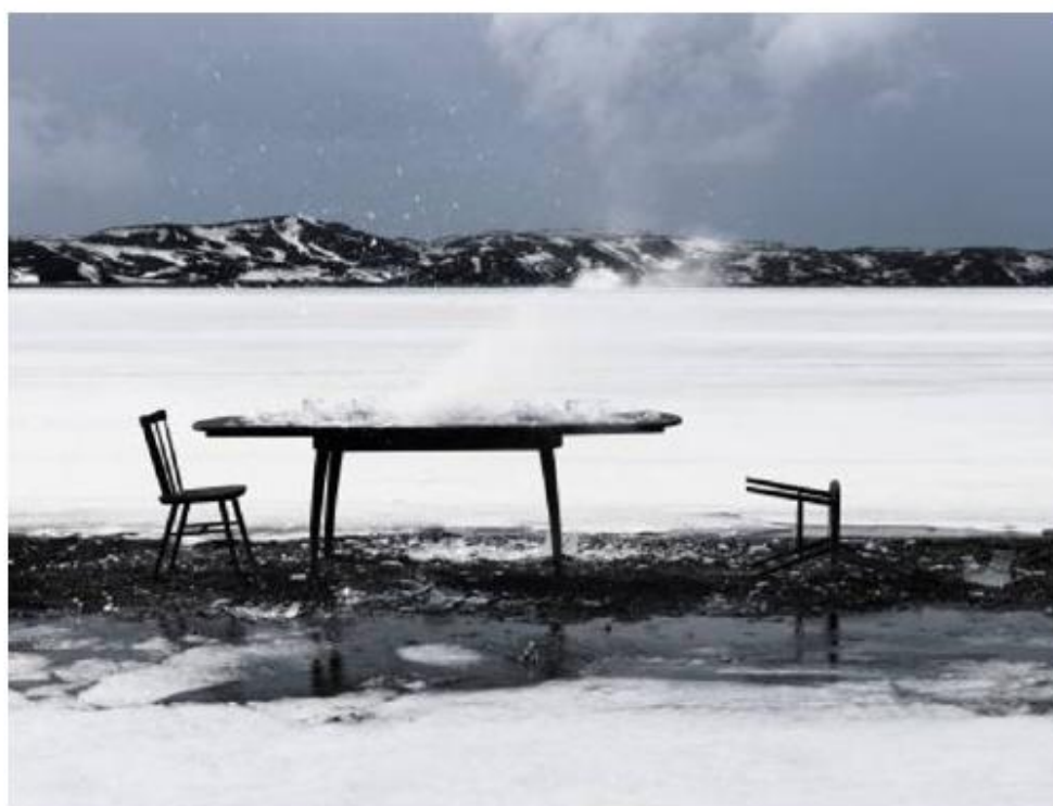
Masbedo - Teorema di incompletezza - 2008 - video

"Energia:Umanità=Futuro:Ambiente" . Il progetto di promozione degli artisti e dell'arte contemporanea è stato realizzato in accordo con il ministero per i Beni e le attività culturali. E si è aperto ufficialmente il voto per il Premio Online: sarà possibile esprimere la propria preferenza fino al 20 ottobre entro le 18, attraverso la grande vetrina di www.premioterna.com